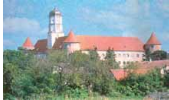
Das Höchstädter Schloss

Schlosskonzerte - „Perlen der Klassik“; Wechselausstellungen; Fayencenausstellung; Sammlung Pellegrini; Dokumentation der Schlacht von 1704