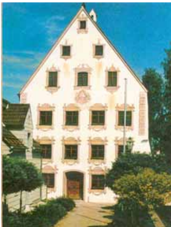
Das „Hürbener Wasserschloss“

Tourismus Information Marktplatz 1 86381 Krumbach Telefon: (08282) 990282 Telefax: (08282) 888687 E-Mail: stadt@krumbach.de Internet: www.krumbach.de