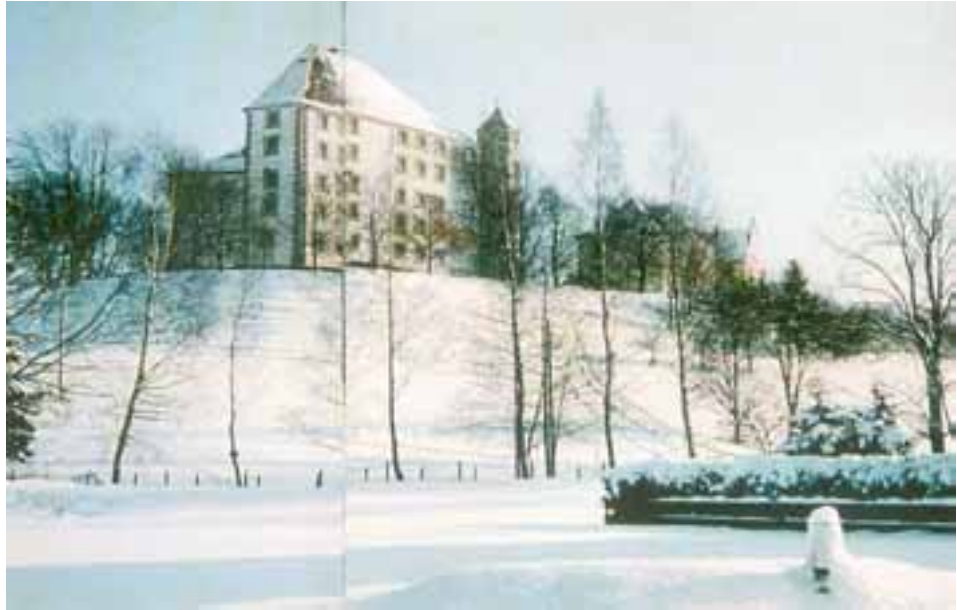
Schloss Bad Grönenbach