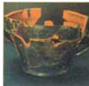
Grundriß der Burganlage Eisenberg