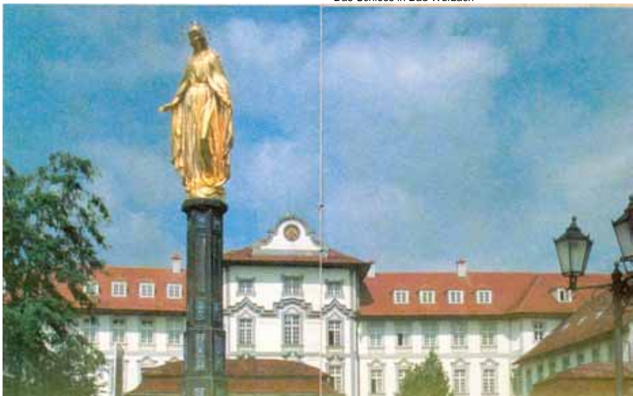
Das Schloss in Bad Wurzach

Kurverwaltung Mühlthorstraße 1 88410 Bad Wurzach Telefon: (07564) 302150 Telefax: (07564) 302154 E-Mail: info@bad-wurzach.de