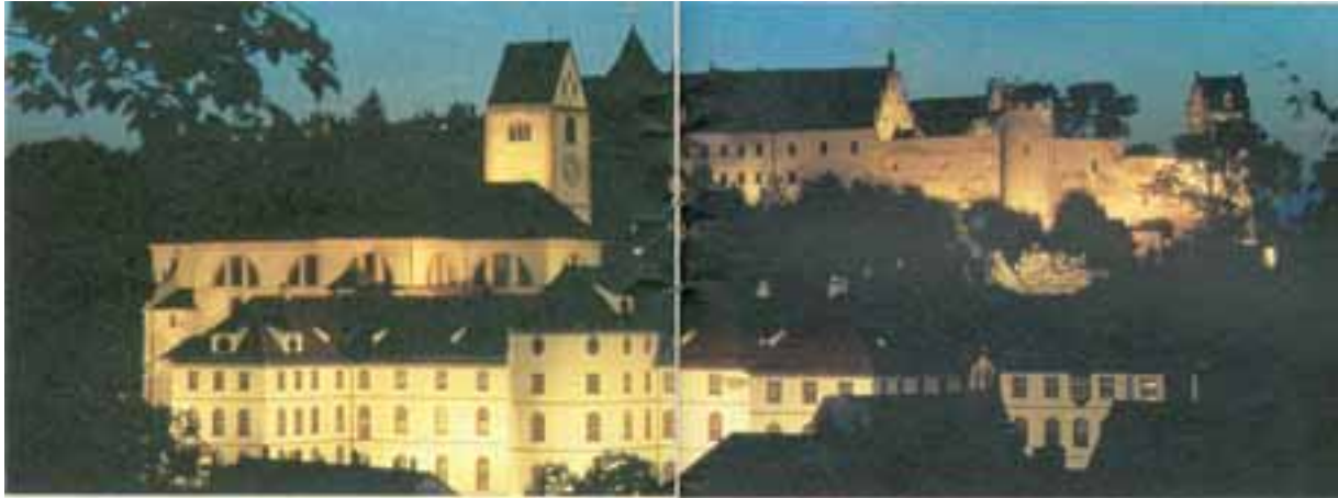
Das „Hohe Schloss“