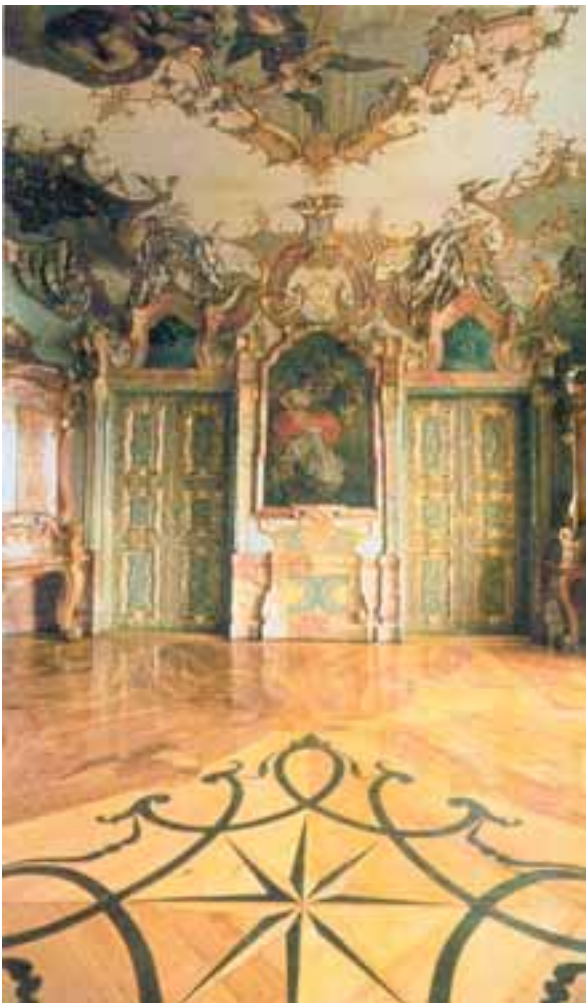
Prunkräume der Residenz in Kempten

Das Zeitalter der Schlösser zog herauf. Eine Zeit, in der bereits stabile Herrschaftsverhältnisse bestanden, in der Fürsten und Könige ihre Macht nicht mehr drohend zeigten, sondern mit einer Prachtentfaltung, die früher nur den Kirchen zustand. Repräsentation war gefragt und Bauten, die mit ihren hierarchisch gestaffelten Ensembles die absolutistische Herrschaftsform widerspiegelten. Die Schlösser dienten als Wohnung, nahmen die Hofhaltung auf und bildeten gleichzeitig die Behörden- und Verwaltungszentren des Territoriums. Sie öffneten sich zu einem Ehrenhof, Gärten wurden in den Gestaltungswillen einbezogen und in geometrische Figuren gezwungen. Jagd- und Lustschlösser, Wasserspiele und Pavillons zeugen von Prunk und Baulust, aber ebenso vom Lebensstil und Anspruch ihrer Besitzer. Mancher von ihnen hat sich und seine Untertanen mit seiner Bauwut in den Ruin getrieben.