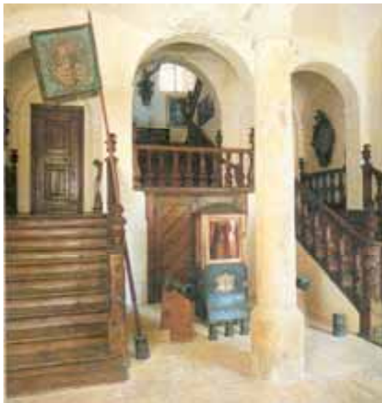
Treppenaufgang im Neuen Schloss Babenhausen

Als Mobiliar dienten Truhen, welche die spärlichen Besitztümer aufnahmen. Bänke, ein paar Stühle. Dazwischen legten Diener auf Schragen die bereits servierte Tafel. Nach dem Essen wurde sie einfach wieder aufgehoben und hinausgetragen. Mit dem spitzen Messer wurden die Fleischstücke aufgespießt und auf das Brot gelegt; die frei herumlaufenden Hunde warteten bereits sehnsüchtig auf die Knochen.