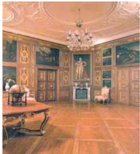
Prunkvoller Salon eines Schlosses

Renaissance, Barock und Rokoko waren die großen Zeiten der Schlösser. Ihre majestätischen Anlagen und prunkvollen Innenausstattungen geben nur einen kleinen Einblick, wie es zugegangen ist, als auch kleine und kleinste Fürsten in diesen Räumen residierten.