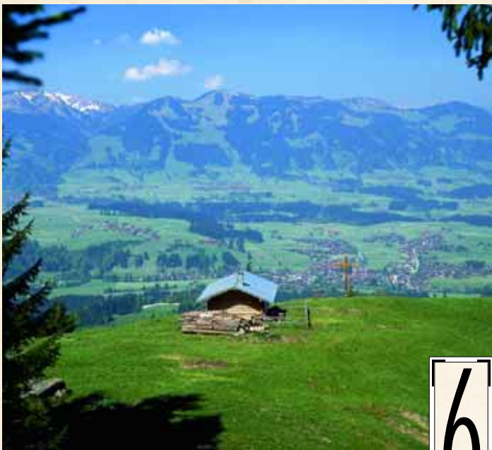
Grasgehrenhütte - Besler - Obermaiselstein - Fischen ca. 5. Std.